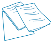
Desafios lógicos com estratégias de solução de problemas