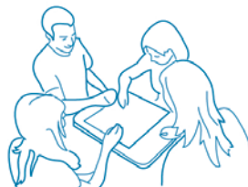
Com passatempos desenvolve-se liderança, expressão e auto-estima